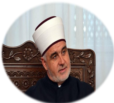
mr.Husein-ef. Kavazović reisu-l-ulema

“Ne postoji ništa što mi vjerujemo, što iskazujemo u našim životima, da je važnije od ljudskog života i sigurnosti ljudi s kojima živimo.”