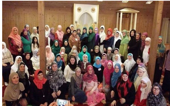
Seminar za aktivne žene džemata IZB u Švedskoj