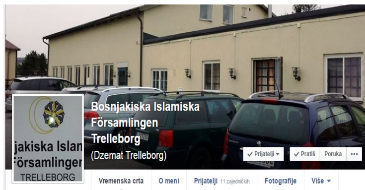
Pratite rad džemata Trelleborg i na facebook