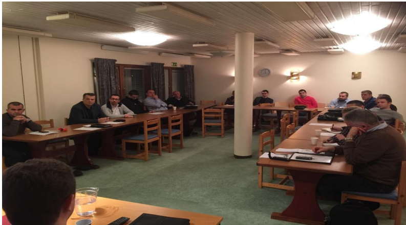
Seminar imama u Gislavedu

Potpisan ugovor o kupovini objekta. U januaru 2015.g. novi vakuf ako Bog da u IZB u Švedskoj! Ugradi sebe u trajno dobro, učestvujte u akciji prikupljanja sredstava za novi vakuf!