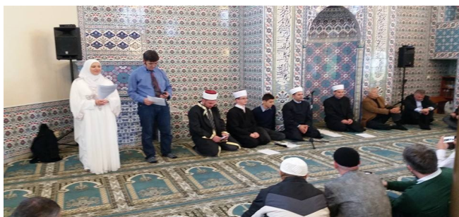
Centralni program manifestacije