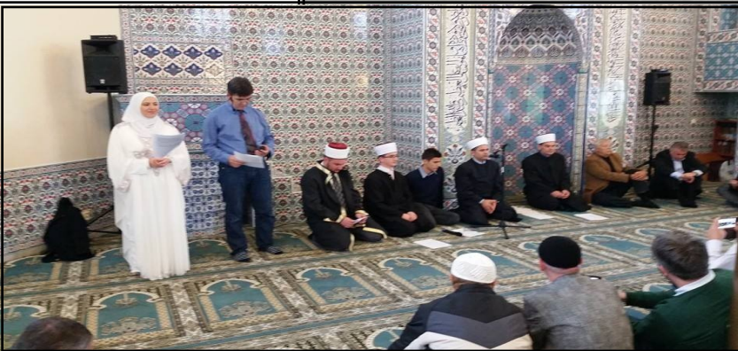
Svečano obilježeno 20 godina džemata Malmö