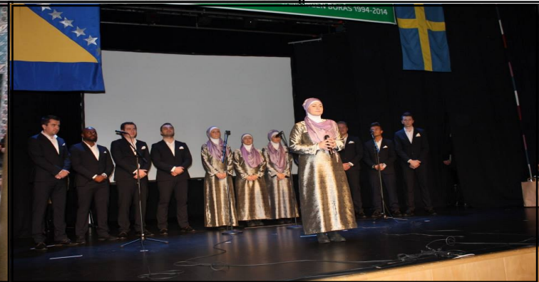
Svečano obilježeno 20 godina džemata Borås