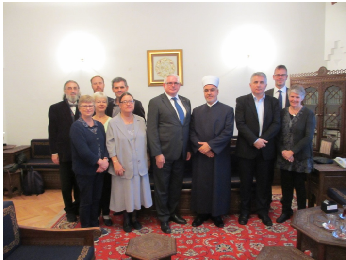
Delegacija SST-a kod Reisu-l-uleme