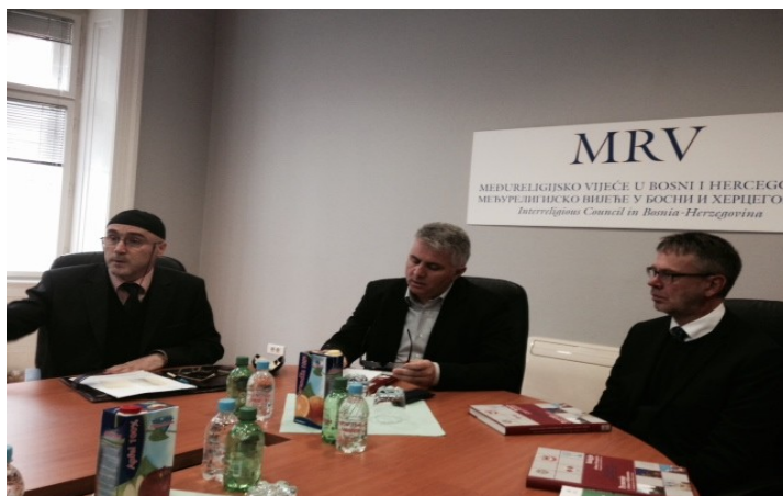
Posjeta međureligijskom vijeću BiH