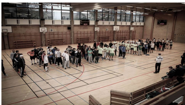
Turnir u nogometu