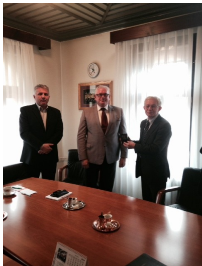
Posjeta Fakultetu islamskih nauka

Delegacija SST-a još je posjetila Kuršumlju medresu, Gazi Husrevbegovu medresu, Fakultet islamskih nauka, Gazi Husrevbegovu biblioteku, Institut za islamsku tradiciju Bošnjaka, te Međureligijsko vijeće.