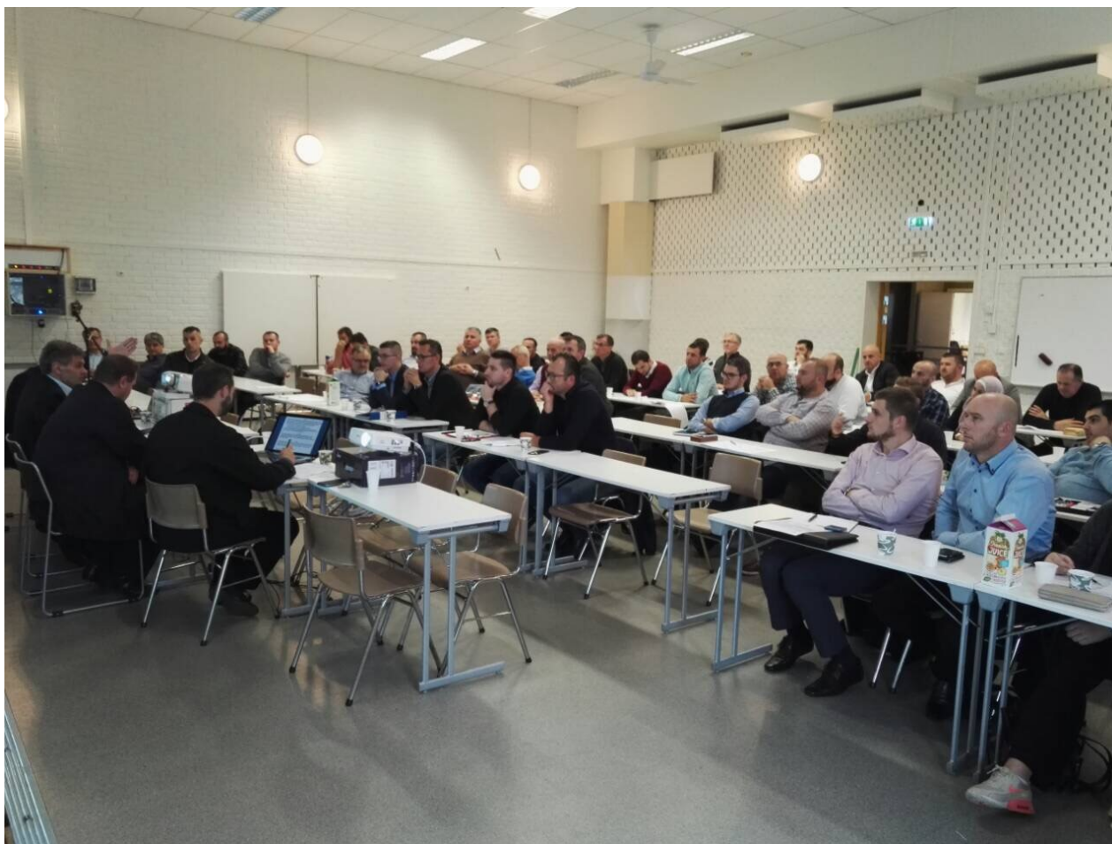
Jönköping: Delegati iz džemata na savjetovanju

Kada su u pitanju projekti „Maternji jezik“ i „Hand i hand“, oba projekta su dobili podršku i zaključeno je da se shodno mogućnostima nastavi sa njihovom realizacijom.