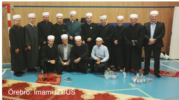
Örebro: Imami IZBUS

Poseban ugođaj bilo je obraćanje izaslanika reisu-l-uleme dr. Fuad-ef. Sedića. Oduševljen svim što je do tada vidio i čuo, te posebno pažnjom kojom su prisutni pratili cijeli program, Fuad-ef. je prvo govorio o važnosti ulaganja na Allahovom putu, džematu, te značaju porodice.