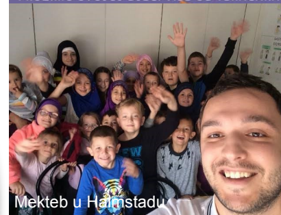
Mekteb u Halmstadu

NE ZABORAVIMO SVOJ IDENTITET PRUŽIMO SVOJJOJ DJECI VIŠE OD IGRAČAKA