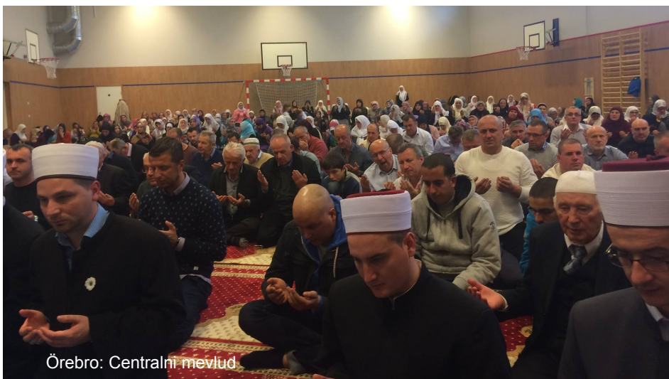
Örebro: Centralni mevlud

Poslije programa vrijedni domaćini pobrinuli su se da svi gosti ove svečanosti budu počašćeni lijepom bosanskom hranom, a onda je upriličena posjeta objektu koji džemat gradi. Bio je to najljepši završetak ovog susreta, kojeg je možda najadekvatnije opisao jedan od posjetilaca.