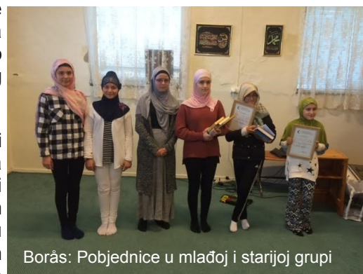
Borås: Pobjednice u mlađoj i starijoj grupi

Inače, takmičenje su pripremili Nezir-ef. Špodić i Hasan-ef. Jašarević.