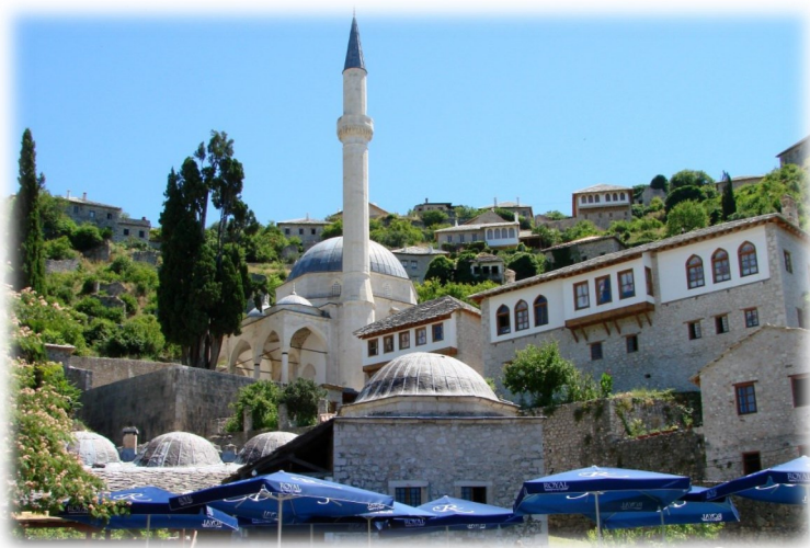
Šišman Ibrahim-pašina džamija, Počitelj, BiH