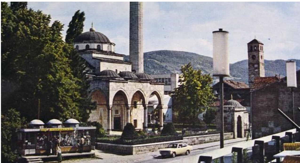
Centralna mevludska svečanost za područje Rijaseta IZ, održana je u utorak 22. decembra 2015. godine u Ferhadiji džamiji u Banjoj Luci, poslije akšam-namaza

Reisu-l-ulema Husein Kavazović prisustvovao je na centralnoj manifestaciji povodom 12. Rebiu-l-evvela, rođendana poslanika Muhammeda a.s., koji je održan u Ferhadiji u Banjoj Luci. "Ferhadija plijeni svojom ljepotom. Drago mi je da smo uspjeli da je obnovimo i vratimo Ferhadiju ovom gradu, koga volimo i u koji rado dolazimo. Nadam se da će ova, kao i druge naše bosanske džamije i dalje nastaviti slati poruke dobra među ljudima, mira i poštovanja. To je njena funkcija uvijek bila i nadam se da će ona ponovo zauzeti ono mjesto koje je bilo izgubljeno njenim rušenjem i slati te važne poruke za sve nas", rekao je reisu-l-ulema Kavazović.