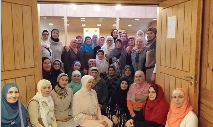
Gislaved: Seminar za žene u organizaciji IZB u Švedskoj