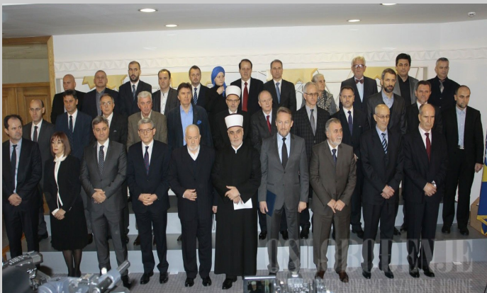
Zajednička izjava najodgovornijih bošnjačkih predstavnika