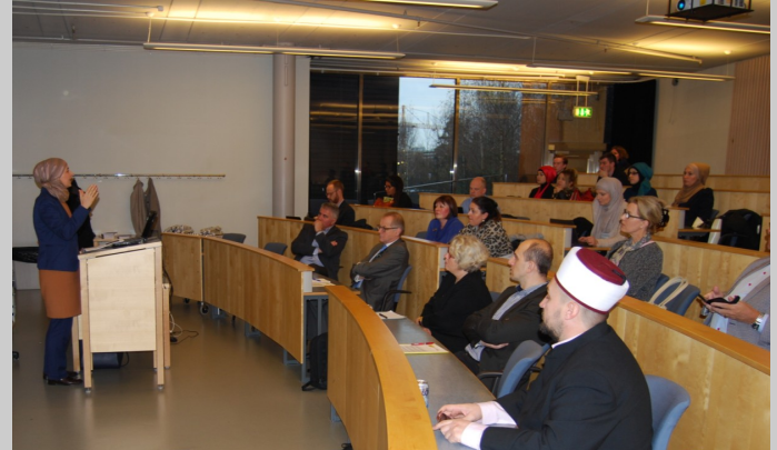
Stockholm: Naučni simpozij "Islam på Bosniska"